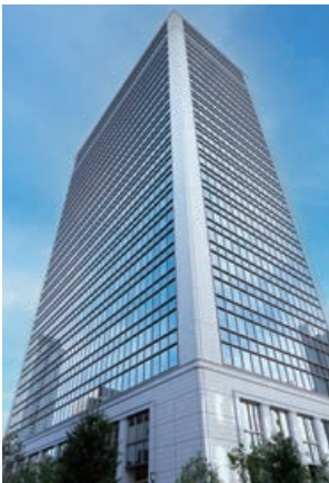
日本生命淀屋橋ビル Nippon Life Yodoyabashi Building